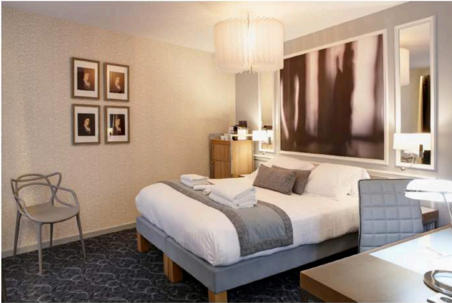
Il faudra entrer dans la salle de bains pour lire une citation d'un livre de Marcel Proust.