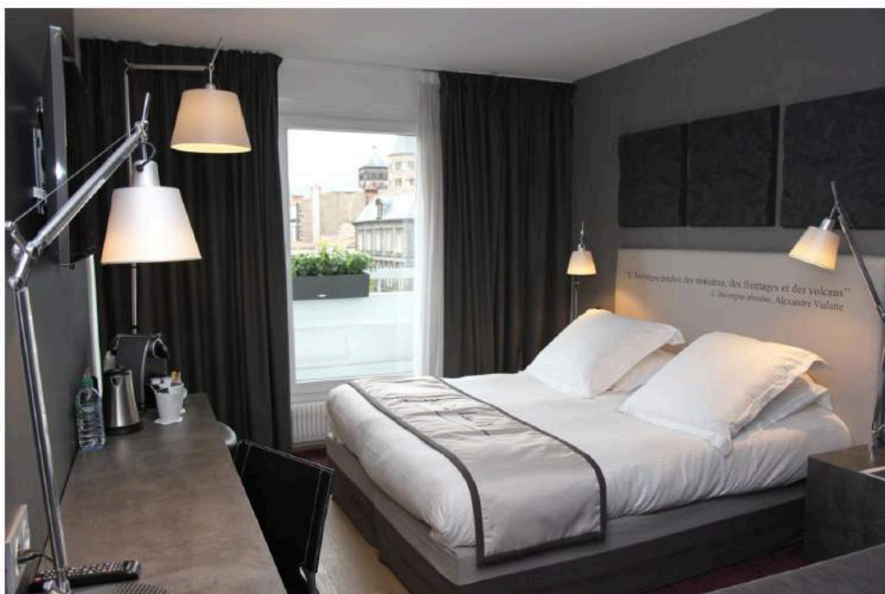
Dans toutes les chambres, une phrase tirée de l'un de ses livres rappelle sa poésie mêlée d'humour.