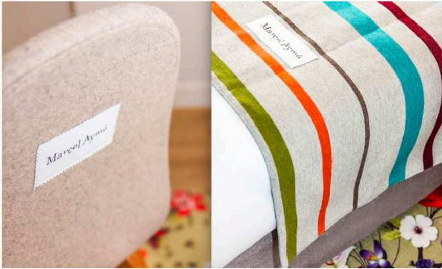
Les chaises, comme les dessus de lits, portent des étiquettes surpiquées au nom de l'écrivain.

Autrefois fréquenté par le dramaturge, le scénariste et l'essayiste français, le quartier Montmartre voit s'ouvrir un nouvel hôtel à son nom. Ses 39 chambres y racontent la vie de l'auteur des Contes du Chat Perché, de La Traversée de Paris et du Passe-Muraille, en offrant aux hôtes de passage un décor unique qui les plonge dans son univers particulier, à grands renforts d'éditions originales, d'affiches de films, de théâtre, et d'une bibliothèque multilingue de plus de 500 livres. 16, rue Tholozé, 75018 Paris. Tél. : 01 42 55 05 06 et www.montmartre-addict.com/hotel-marcel-ayme