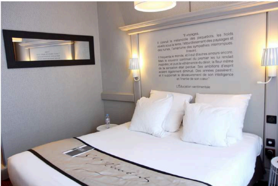
Sur les têtes des lits des 51 chambres s'affichent des citations autour des œuvres ou de l'un des personnages de l'écrivain.