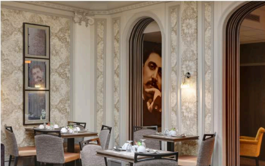
Dans le salon du petit déjeuner, l'effigie de l'écrivain se décline sur les portraits ainsi que sur les miroirs.