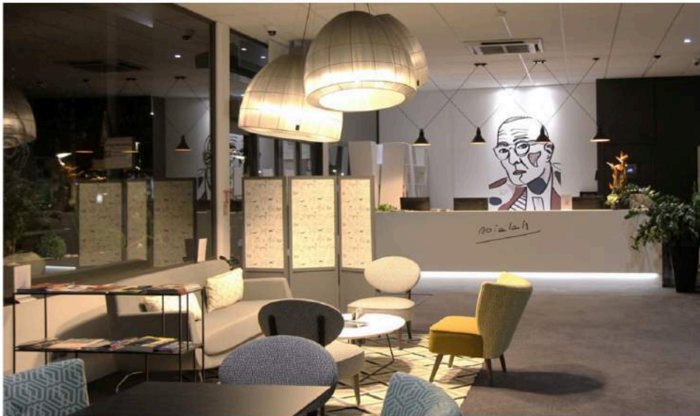
Le desk d'accueil affiche le portrait du grand auvergnat que fut Alexandre Vialatte.