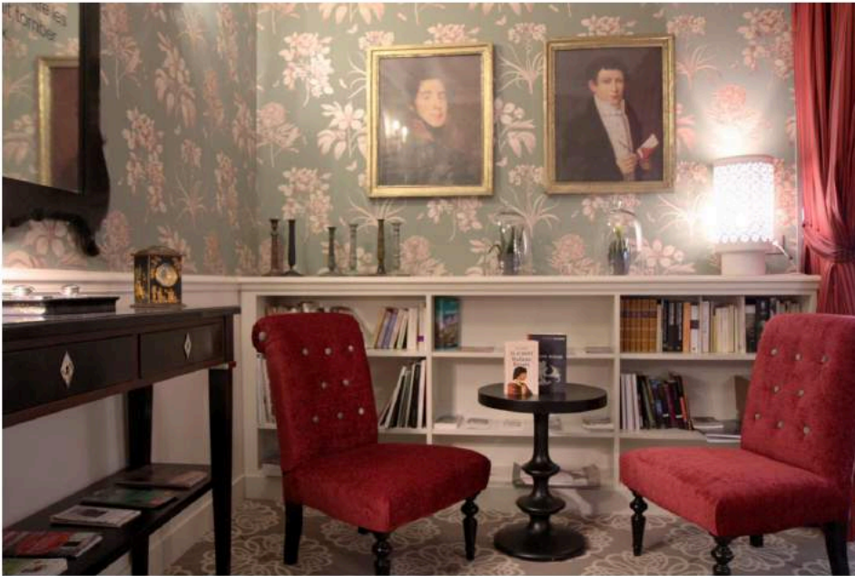
Au Salon Bovary, on s'offre un cocktail et un bon moment de lecture partagée.

Au cœur de la capitale normande, ce refuge romantique glorifie Gustave Flaubert. Dès l'entrée, on tombe sous le charme de la décoration du 4 étoiles conçu par l'architecte Aude Bruguère où les alcôves cosy prolongent un bar chaleureux, idéal pour siroter un cocktail en fin de journée, et dont la bibliothèque est dotée de 500 livres, édités en 20 langues. Sans oublier une grande partie de sa correspondance avec Ivan Tourguéniev, George Sand, Guy de Maupassant et les frères Goncourt... 33, rue du Vieux Palais, 76000 Rouen. Tél. : 02 35 71 00 88 et www.hotelgustaveflaubert.com